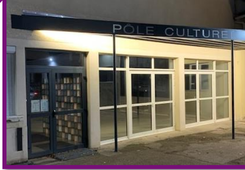
Installation de l'éclairage au Pôle Culturel