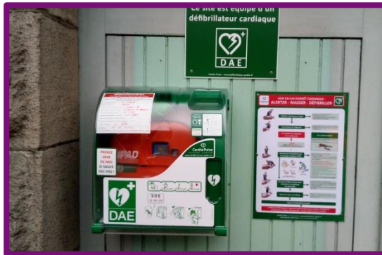
Installation d'un défibrillateur sur les portes du sous-sol de la Mairie.