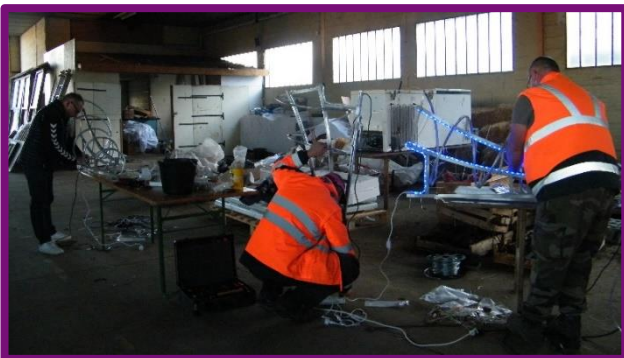
Fabrication d'illuminations de Noël et installation des sapins par nos services techniques