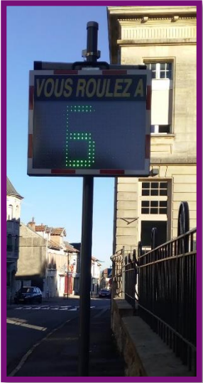
Installation d'un radar pédagogique pour la zone à « 30 » au Centre Bourg