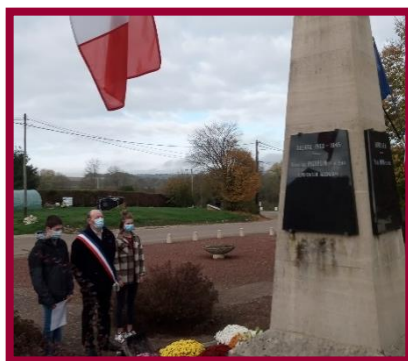
Jubécourt, Le 11/11/2020