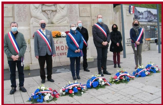
Clermont, Le 11/11/2020