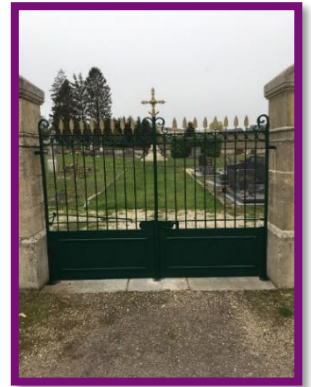
Remise en peinture du portail du cimetière d'Auzéville